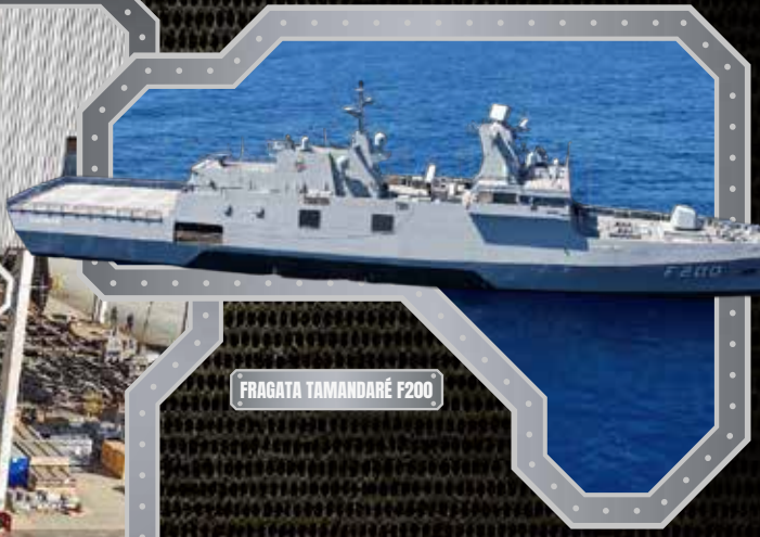
FRAGATA TAMANDARÉ F200